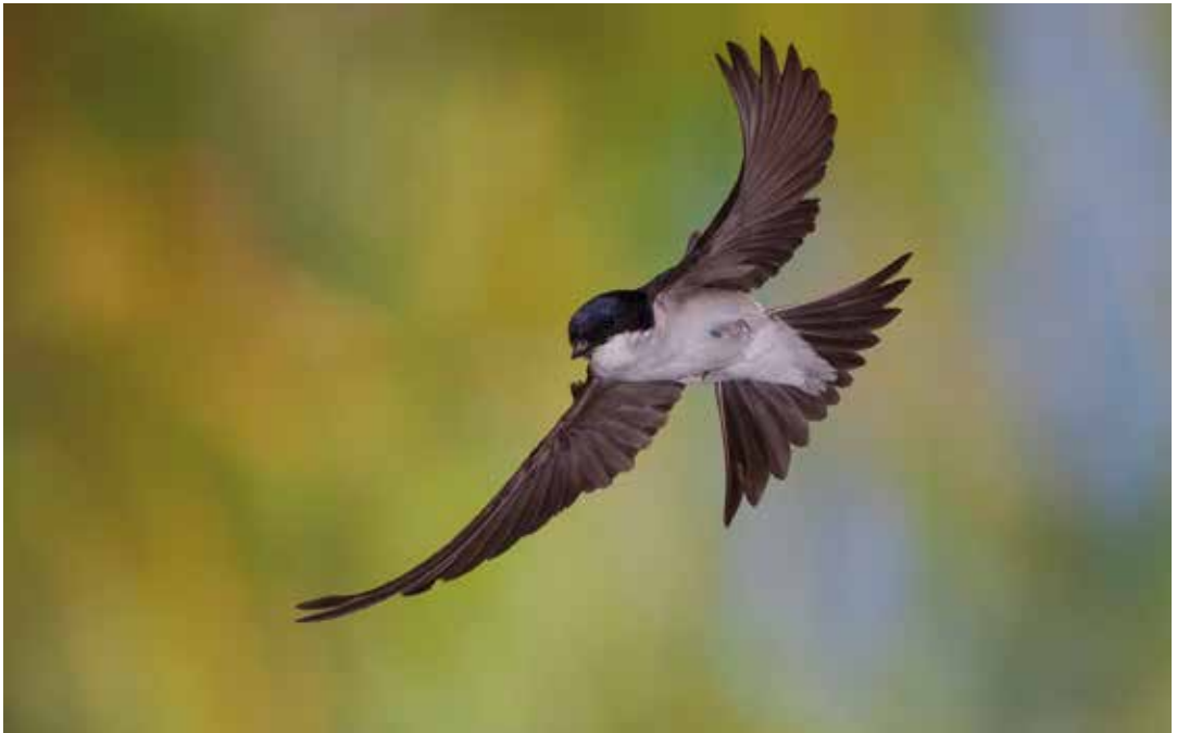
Mehlschwalbe Delichon urbicum , 28.06.2012, Gierstädt, Thüringen. – Common House Martin.