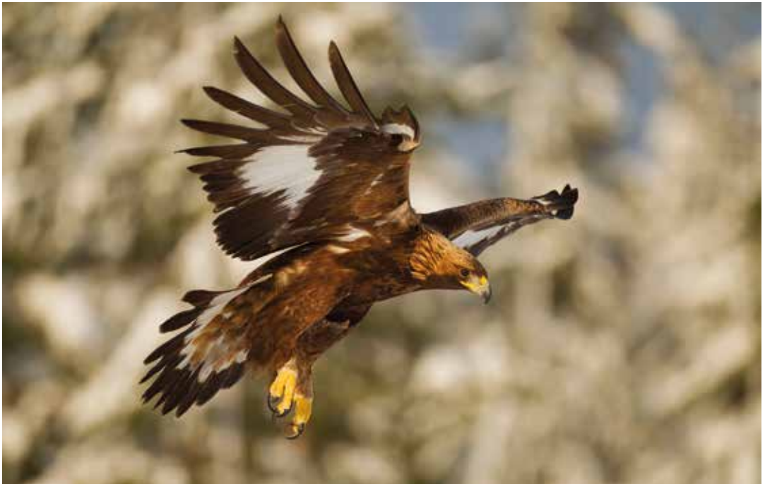
Steinadler Aquila chrysaetos, 11.02.2013, Finnland. – Golden Eagle.