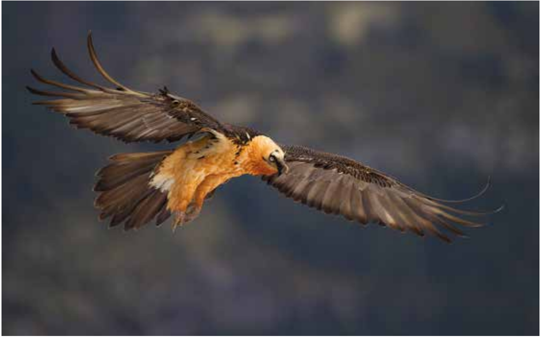
Bartgeier Gypaetus barbatus, 11.04.2012, Pyrenäen, Nationalpark Ordesa y Monte Perdido. – Bearded Vulture.