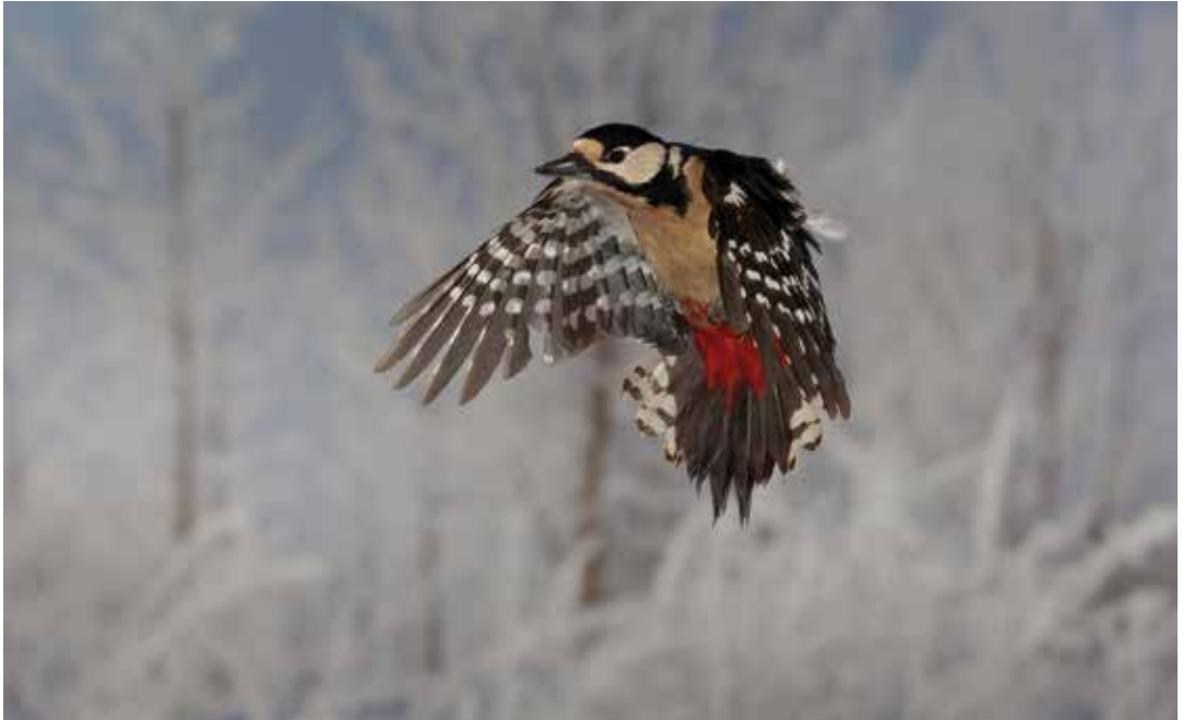
Buntspecht Dendrocopos major , 17.03.2013, Erfurt, Thüringen. – Great Spotted Woodpecker.