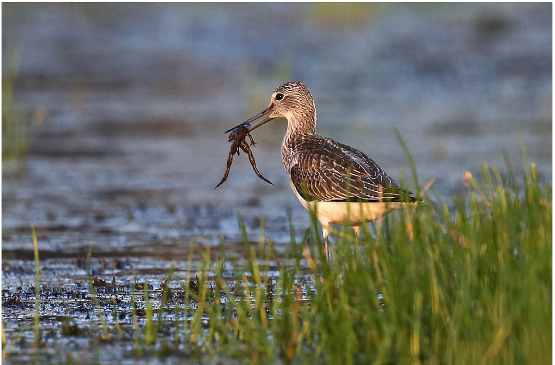
Grünschenkel Tringa nebularia erbeutet Frosch, Stöhmaer Becken b. Leipzig, 13.08.2016.