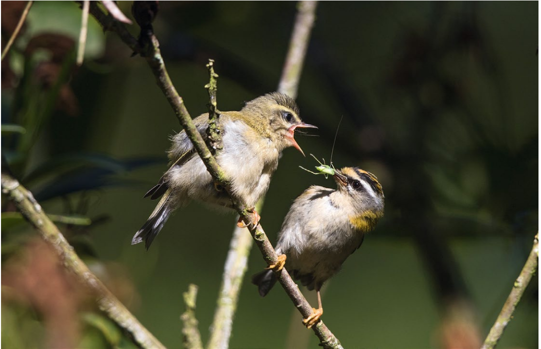
Sommergoldhähnchen Regulus ignicapilla , Südfriedhof Leipzig, 18.06.2016.