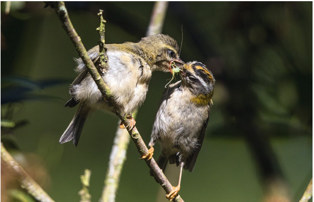
Sommergoldhähnchen Regulus ignicapilla , Südfriedhof Leipzig, 18.06.2016.