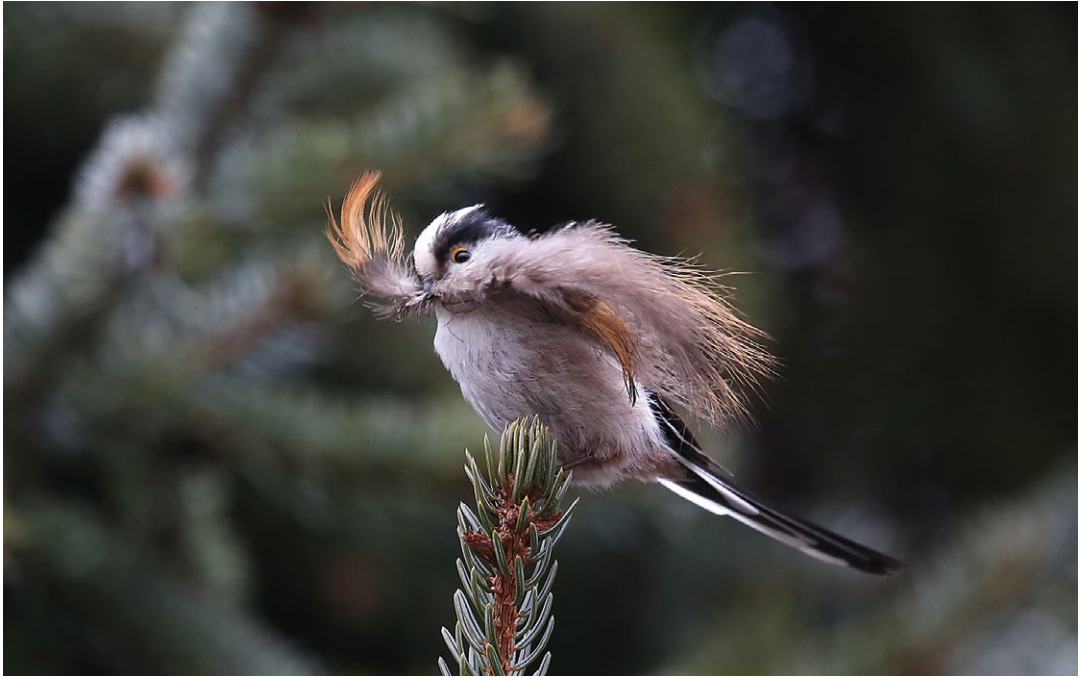
Schwanzmeise Agithalos caudatus trägt Feder ein, Markkleeberg/Sachsen, 19.03.2016.