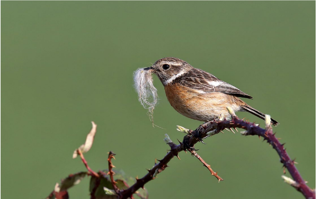
Schwarzkehlchen-Weibchen Saxicola rubicola , Markkleeberg/Sachsen, 05.04.2016.