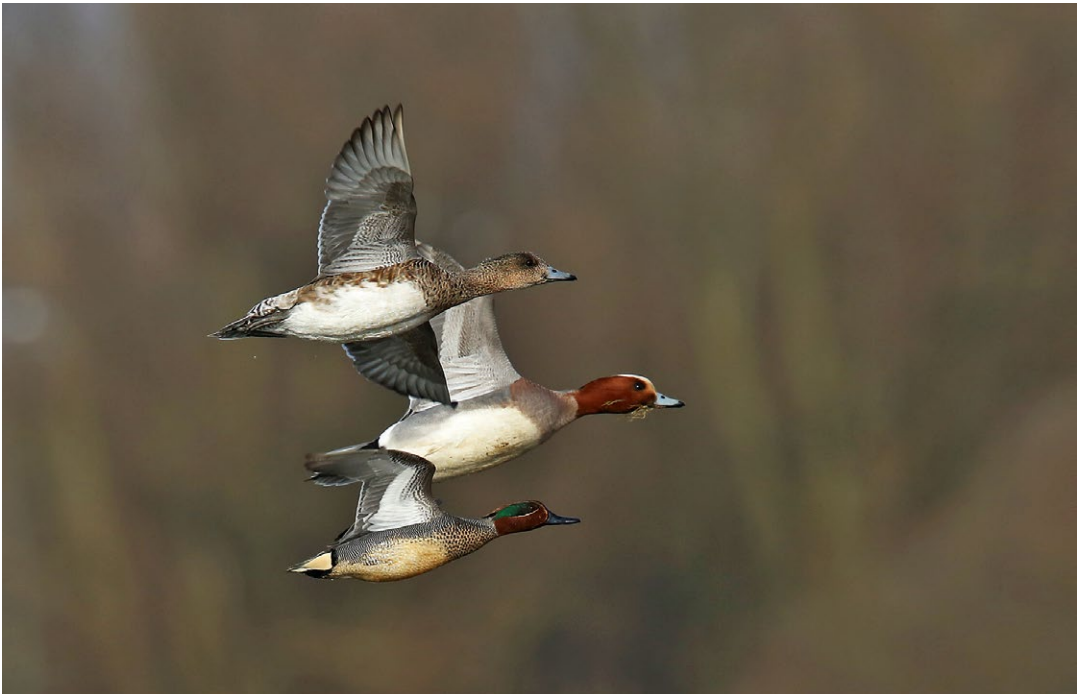
Pfeifenten Mareca penelope und Krickente Anas crecca , Stöhmaer Becken b. Leipzig, 26.03.2016.